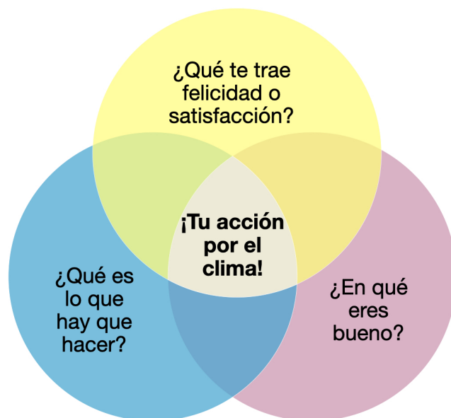
Figura 1. Diagrama de Venn para la acción climática, traducido de: https://www.ayanaelizabeth.com .

Finalmente, en este mes de mayo deseo felicitar a todas las madres. Si eres mamá y te preocupas por el planeta de tus hijos, busca ScienceMoms . ScienceMoms es un grupo de madres y científicas que busca ayudar a las mamás que aún no saben cómo ayudar a frenar el cambio climático.